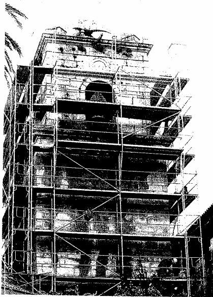
Además de la limpieza de maleza, las piedras de la torre serán «cintadas» | EDUARDO

La puerta principal mantendrá la cubierta de zinc y los viejos cerrajes